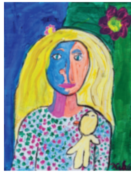
Nika Čorda 3. razred, Udruga „Art sinergija“ mentorica: Dijana Nazor Čorda