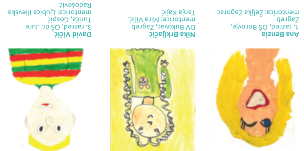
Ana Benza 1. razred, OŠ Borovje, Zagreb mentorica: Željka Zagorac

Na natječaj poziva odazvali su se mentor i u ovaj kreativni proces istražujući temu autoportreta ili portreta. Jedan od naših glavnih ciljeva natječaja je poticanje dječje kreativnosti, njegovanje likovnog stvaralaštva te omogućavanje djetetu da izrazi svoje emocije i razvija maštu. Jedinstvenu priliku da se bave pitanjima identiteta, samopoznavanja i fizičke sličnosti, već i svoje unutrašnje osjećaje, misli i osobnost. Ova vrsta interaktivnog stvaralaštva pomaže im da na vizualan način artikuliraju tu i kako doživljavaju sebe u svijetu.