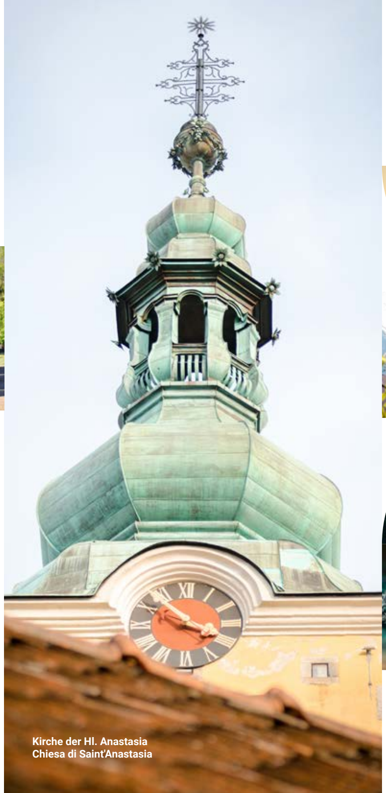
Kirche der Hl. Anastasia Chiesa di Saint'Anastasia

La miniera di Santa Barbara si trova a Rude, a 5 km in direzione sud-ovest da Samobor. L'itinerario odierno di visite passa per la parte rinnovata del pozzo della Trinità e per i suoi vecchi segmenti non rinforzati, attraverso gli sterri di minerale ferroso si arriva al pozzo superiore di Kokel scavato più di tre secoli fa. Durante la vostra visita, informatevi sulla storia ricca e sulla tradizione mineraria di Rude nonché sulla diversità geologica con le presentazioni realistiche di rocce e minerali. Forse vi capita di incontrare i "bergman", nani che tempo fa occupavano i pozzi e distraevano i minatori nel lavoro quotidiano.